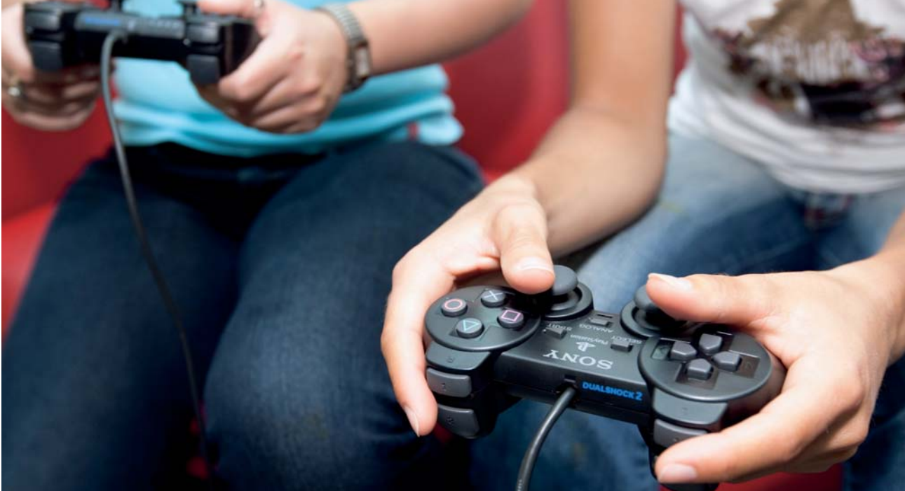
Zwei Jugendliche beim Computerspielen: Gaming ist eine beliebte Freizeitbeschäftigung, die Chancen und Risiken beinhaltet. Die KJM ist für den Jugendschutz in Online-Spielen zuständig.

(JuSchG) auf Bundesebene und der bereits genannte JMStV auf Länderebene.