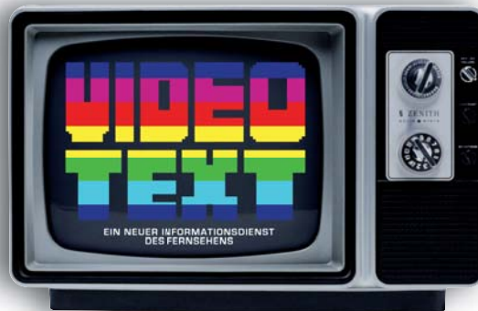
In Deutschland gibt es Teletext seit den 70ern.

die Probleme hin und erreichte, dass die betroffenen Anbieter eine gemeinsame Empfehlung der Jugendschutzbeauftragten der privaten Sender umsetzten. Sie zeigten die Erotikwerbung im Teletext nur noch zwischen 22.00 und 6.00 Uhr und kamen damit ihrer Eigenverantwortung im Rahmen der Selbstkontrolle vorbildlich nach.